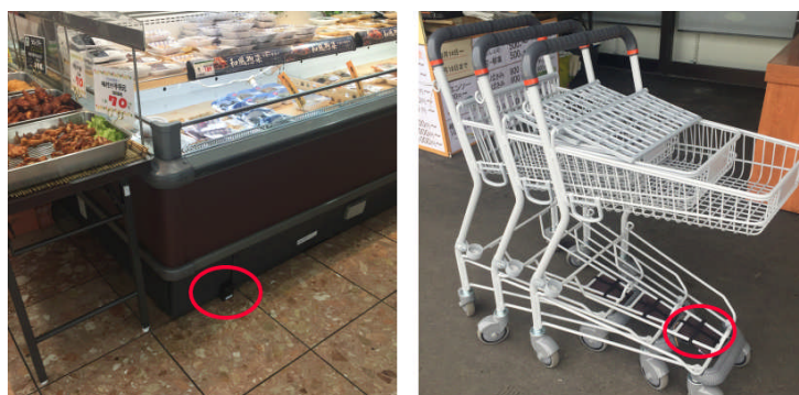
店舗内に設置したiBeaconとカートに装着したスマートフォン

動線の収集・分析には、株式会社インフォキューブLAFLAが提供する、iBeaconとスマートフォンにより動線収集・分析を行うクラウドサービス「GeoSTRATOS」を用い、店内に数十個のiBeaconを配置の上、数台のショッピングカートにスマートフォンを装着して、実際のお客様にご利用いただきました。実証実験は、延べ3日間実施し、数百名の動線データを収集しております。